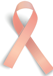
Tumore uterino e dell'endometrio